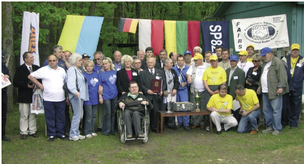
Zdjęcie grupowe jako końcowe z oficjalnych wystąpień. Szkoda, że na tym zdjęciu nie ma wielu osób, rozeszły się właśnie na obiad