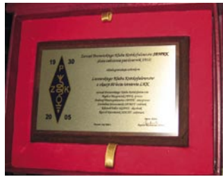
Pamiątkowe plakietki, przekazane Lwowskiemu Klubowi Krótkofalowców

Po tych wyczerpujących oficjalnych spotkaniach około 13:00 wszyscy udali się na skromny obiad w stołówce ośrodka. Gości było tak wiele, że posiłki były wydawane na raty. W tym samym czasie czynna był giełda sprzętowa, jednak proponowane przez kolegów ukraińskich wystawców nie były dla nas, Polaków, zbyt atrakcyjne. Jak zwykle na takich spotkaniach dominowały rozmowy indywidualne.