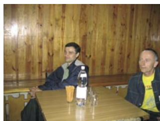
Goście z LKK