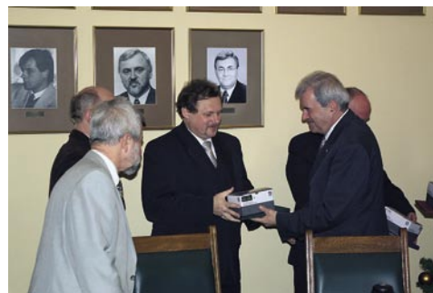
Prezydent Bydgoszczy wręcza nagrody najaktywniejszym krótkofalowcom