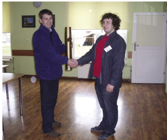
Puchar prezesa Delty za zawody strzeleckie SQ8SBZ