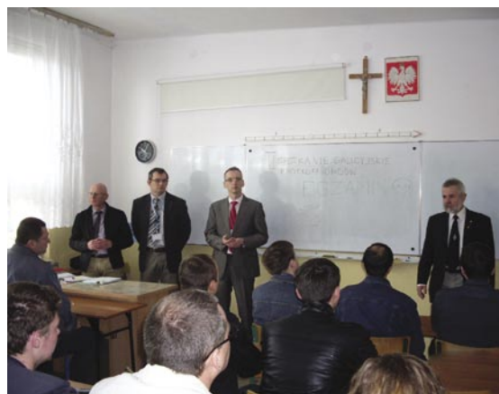
Ostatnie rady przed egzaminem