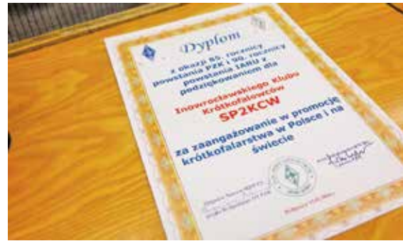
DYPLOM DLA KLUBU SP2KCV